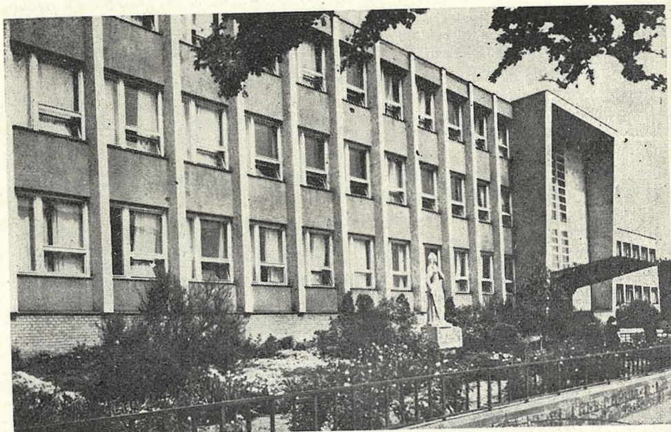
Új iskolánk. Épült 1962-ben.