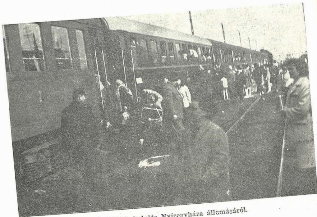
Kirándulásra indulás Nyiregyháza állomásáról.